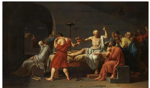
Jacques-Louis David, Morte di Socrate (1787)

per le donne e fra i venticinque e i cinquanta per gli uomini. Platone, dunque, prescrive un aborto imposto a chiunque