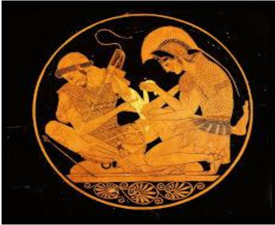
Dettaglio di piatto decorato. Achille benda Patroclo

Lettera per il Networking, Qualità, Sensemaking e Relazioni