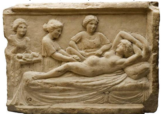
Bassorilievo romano raffigurante una partoriente

Ciò non vuol dire però che, per gli Stoici, l'aborto sia permessibile in tutti i casi. Alcune giustificazioni non sono accettabili per esso, in quanto derivanti da un'interpretazione troppo estrema del principio appena discusso. In particolare, Seneca (4 a.C. - 65 d.C.) ci