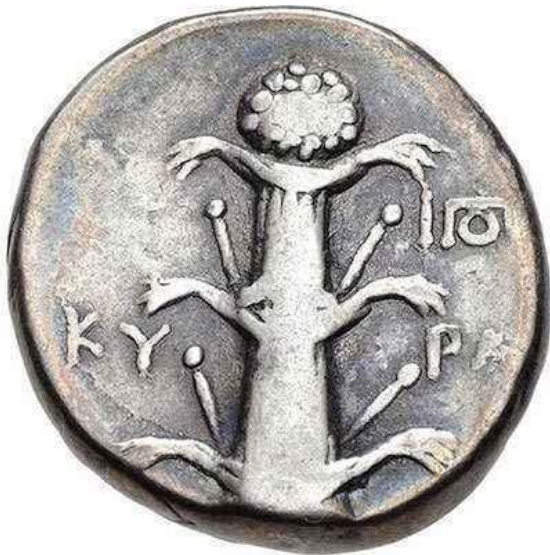
Moneta raffigurante il silfio, un potente abortivo

Infine, un altro passaggio nelle opere platoniche è degno di nota. Ci riferiamo alla trattazione del suicidio nelle Leggi , in cui Platone non condanna il suicidio per chi si trovi in uno stato debilitante o di acuta sofferenza o chi ancora sia affetto da un morbo incurabile.