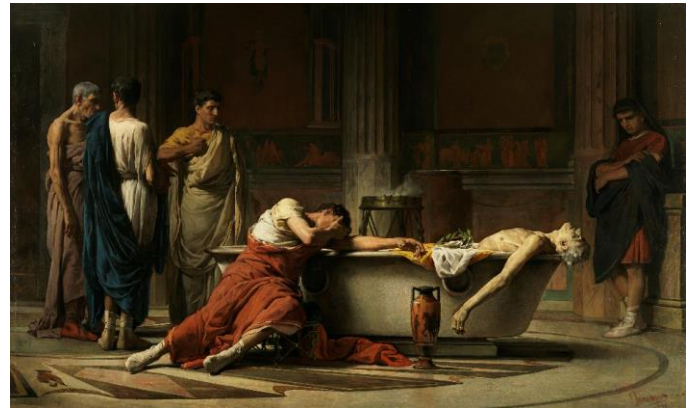
Manuel Domínguez Sánchez, Morte di Seneca (1871)

stesso modo i mali del corpo sono degli indifferenti . Qui è in gioco non il corpo, ma l'anima. Se l'anima non può più utilizzare il proprio corpo per il raggiungimento della felicità diventa irrazionale rimanere in questa vita, invece di dividere immediatamente anima e corpo. Il saggio stoico, infatti, si toglierà la vita se affetto da malattie incurabili e debilitanti.